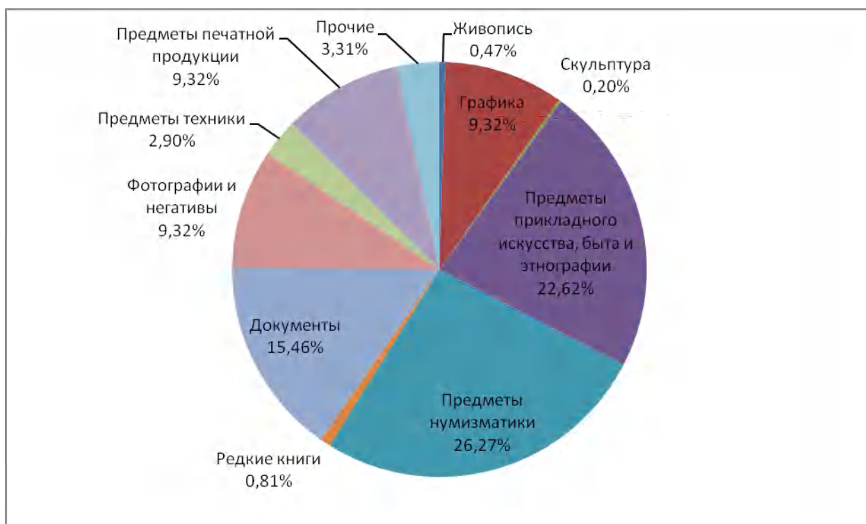
Диаграмма количественного распределения фондовых коллекций музея села Знаменка